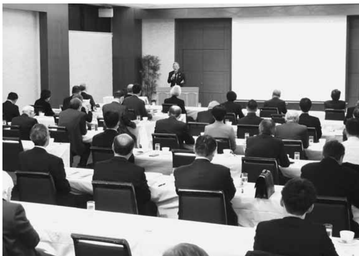
逆境を乗り越える経営手法について学んだ講演会

実践しながら経営されてきた。「今まで、取引銀行の破綻や制度の改正等により3回ほど会社存続の危機に見舞われたが、持ち直す可能性が50%あれば売上を伸ばすことが出来る」と信じ、頑張ってきた。経営者の皆さんも、逆境に立たされるのがあっても、そこで諦めずに踏ん張って経営に取り組み、生まれてきた証をつくってほしい」と呼び掛けた。聴講した議員らは山あり谷ありの経営者人生について熱心に聞き入っていた。セミナー終了後には、懇談会で互いの交流を深め、団結を強めた。