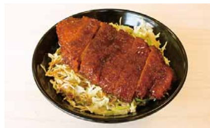
一番人気のソースカツ丼(600円)▲