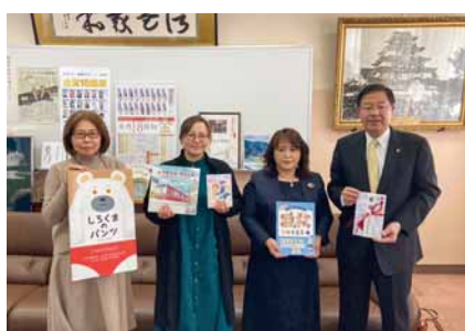
室井市長(写真右)へ児童向け図書を寄贈する女性会メンバー

また3月には新たな支援先として、社会福祉法人会津児童園を訪問し寄付を行う。寄付金は子どもたちの