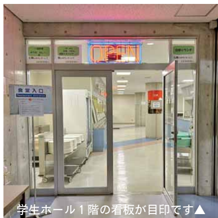
学生ホール1階の看板が目印です▲

今回の事業所はいけんは、会津大学の学生食堂・売店・ブックセンターなどの運営を行う(有)スチューデントライフサポートさんにお邪魔しました。(有)スチューデントライフサポートは、会津大学生の学生生活のサポートを目的に、当商工会議所の活動の中から生まれた会社です。平成10年の設立から、学生への多方面の支援を通して地域貢献活動に取り組まれています。