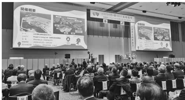
全国から1800名以上が参加した観光振興大会