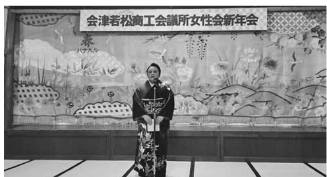
様々な取組に理解と協力を求める村崎会長