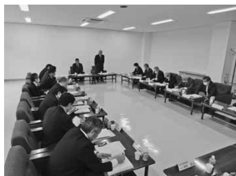
的確な税制支援について協力を求める洪川会頭

https://www.jcci.or.jp/file/sangyo1/202501/r7_zeiseikaisei.pdf