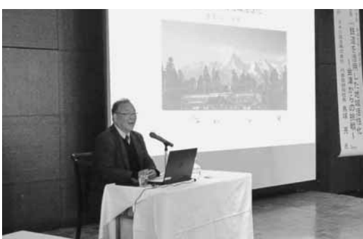
鐵道再生の取組事例を説明する鳥塚社長